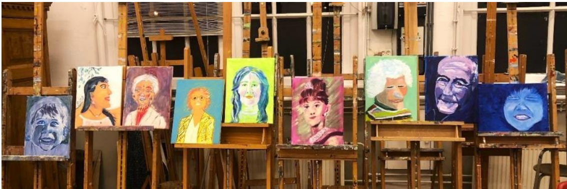
Werk van vorige deelnemers aan het eind van de workshop

In deze zomerse workshop kan je werken aan een portret geïnspireerd op de fauvisten met heldere kleuren en een duidelijke schildertoets. Je krijgt tips van Marieke hoe je het portret het beste kunt opzetten. Ervaring met schilderen heb je niet per se nodig. Ook beginners zijn welkom. Je maakt het schilderij naar een zelf meegebrachte portretfoto van een icoon of iemand die je liefhebt, een zelfportret mag ook!