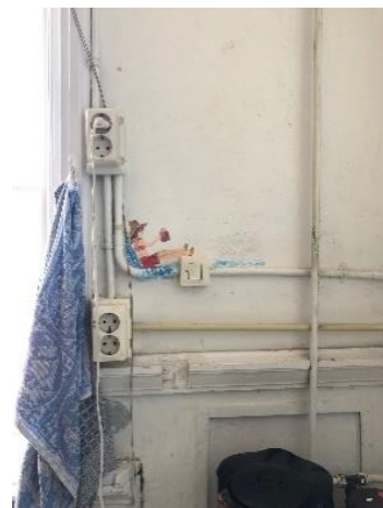
Electra in Atelier 2