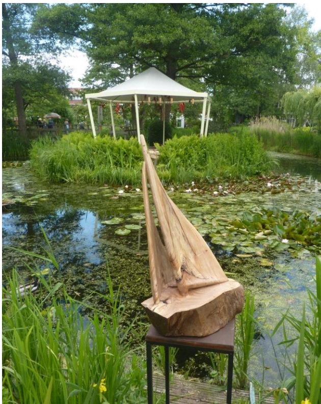
En het hout was blikvanger in de presentatie in de tuin van Kapitein Rommel.