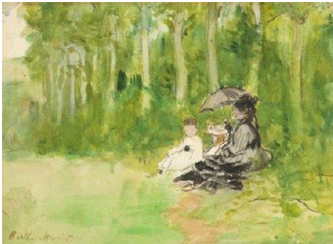
Berthe Morisot, In het bos, 1876

Het is wat lastig om ruim tevoren een tijdslot te moeten reserveren en laat je ook niet afschrikken door de vele toeristen die dit museum bezoeken. De buitenlandse toeristen lopen door naar de vaste collectie en staan te dringen om de amandelbloesemschilderijen van Van Gogh en komen niet naar de speciale tentoonstelling ‘Vive l’impressionisme’. Bij ons bezoek konden we dit op ons gemak bekijken.