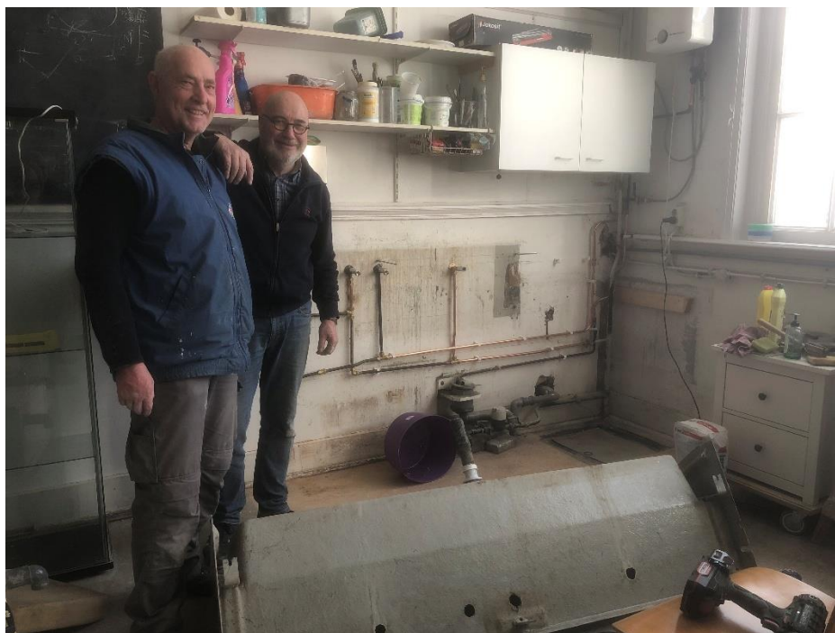
Nieuw leidingwerk in Atelier 2 voor twee nieuwe kranen boven de bezinkbak